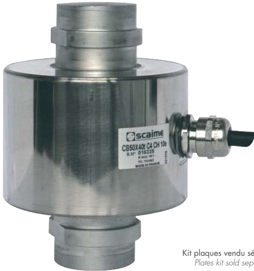
Kit plaques vendu séparément Plates kit sold separately