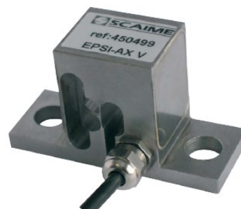
Sensore EPSI-AX Dimensioni mm - 70x25x40h