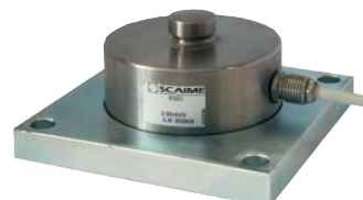
Kit de montage PLAQUE R10X R10X PLATES mounting kit