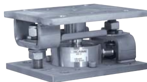
Kit de montage SILOKIT-R SILOKIT-R mounting kit