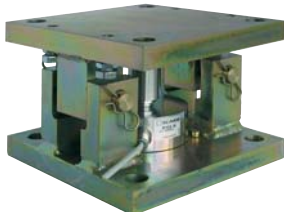
Kit de montage SILOSAFE-R SILOSAFE-R mounting kit