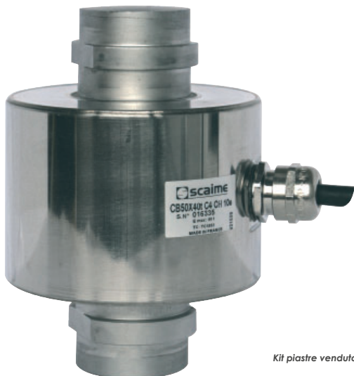
Kit piastre venduto separatamente